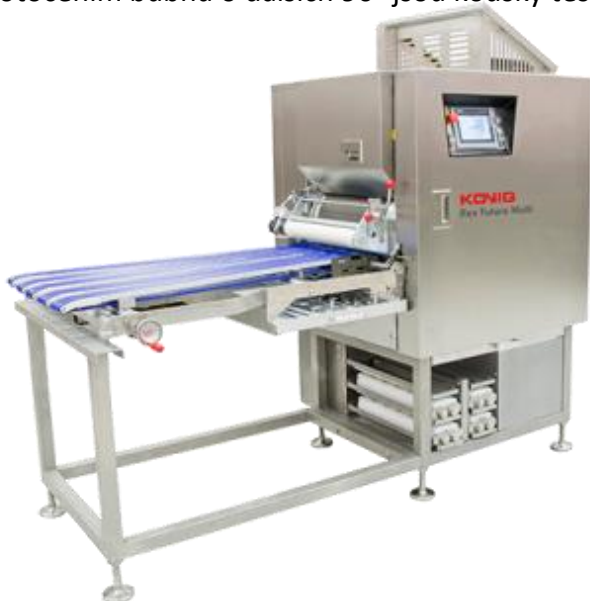
Výměnné vložky dělicího bubnu – počet řad 1 až 8:

Princip fungování: násypka se naplní těstem, hvězdicovitými válci v její dolní části je těsto volně oddělováno do prostoru k podávacímu pístu, kde dochází k volnému vtlačení do komůrek dělicího bubnu. Přebytečné těsto je lehce vytlačeno nad podávací píst a zpracováno v dalším kroku. Následně dojde k pootočení bubnu o 90° a případnému vykoulení těsta pomocí excentrické vykulovací desky nad bubnem. Pootočením bubnu o dalších 90° jsou kousky těsta vysunuty na výstupní pás.