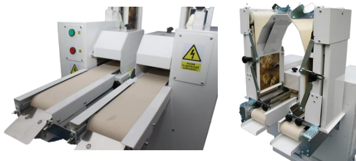
↑ typ 2H1 s dvojitým svislým vkládáním