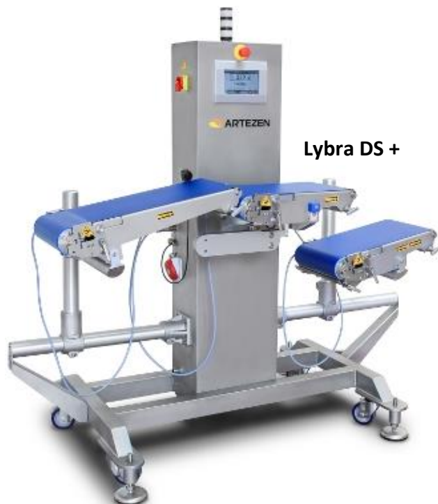
Lybra DS +